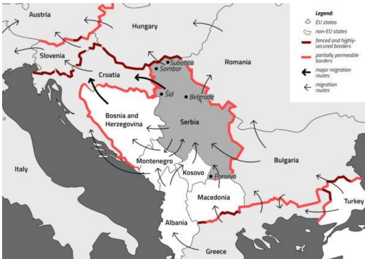
3. ábra: Határkerítések és migrációs mozgások Délkelet-Európában, 2019. májusi állapot 21

A tömeges, ellenőrizhetetlen, irreguláris migrációra számos állam műszaki határvár kiépítésével válszott. Igaz, a kerítések építését több ország már a 2015-ös válság előtt megkezdte. Görögország például még 2011 októberében kezdte el az első, rövidebb határvár kiépítését a török határon, míg Bulgária 2014 januárjában. 2015-től aztán a magyar–szerb, a magyar–horvát, a görög–észak-macedón, a szlovén–horvát és az osztrák–szlovén határon is hosszabb-rövidebb műszaki határvárok épültek, majd 2020-ban a szerb–észak-macedón határon is kerítés építésébe kezdtek. A nyugat-balkáni útvonal kerítésekkel történő lezárásának hatására az Észak-Macedónia–Szerbia irány helyett az illegális migrációs forgalom Albánia, illetve Bosznia-Hercegovina felé terelődött. A kerítésépítési trenddel Szlovénia fordult szembe először: az új szlovén kormány 2022 júliusában a horvát határon kiépített 200 kilométer hosszú kerítés lebontásáról döntött. 20