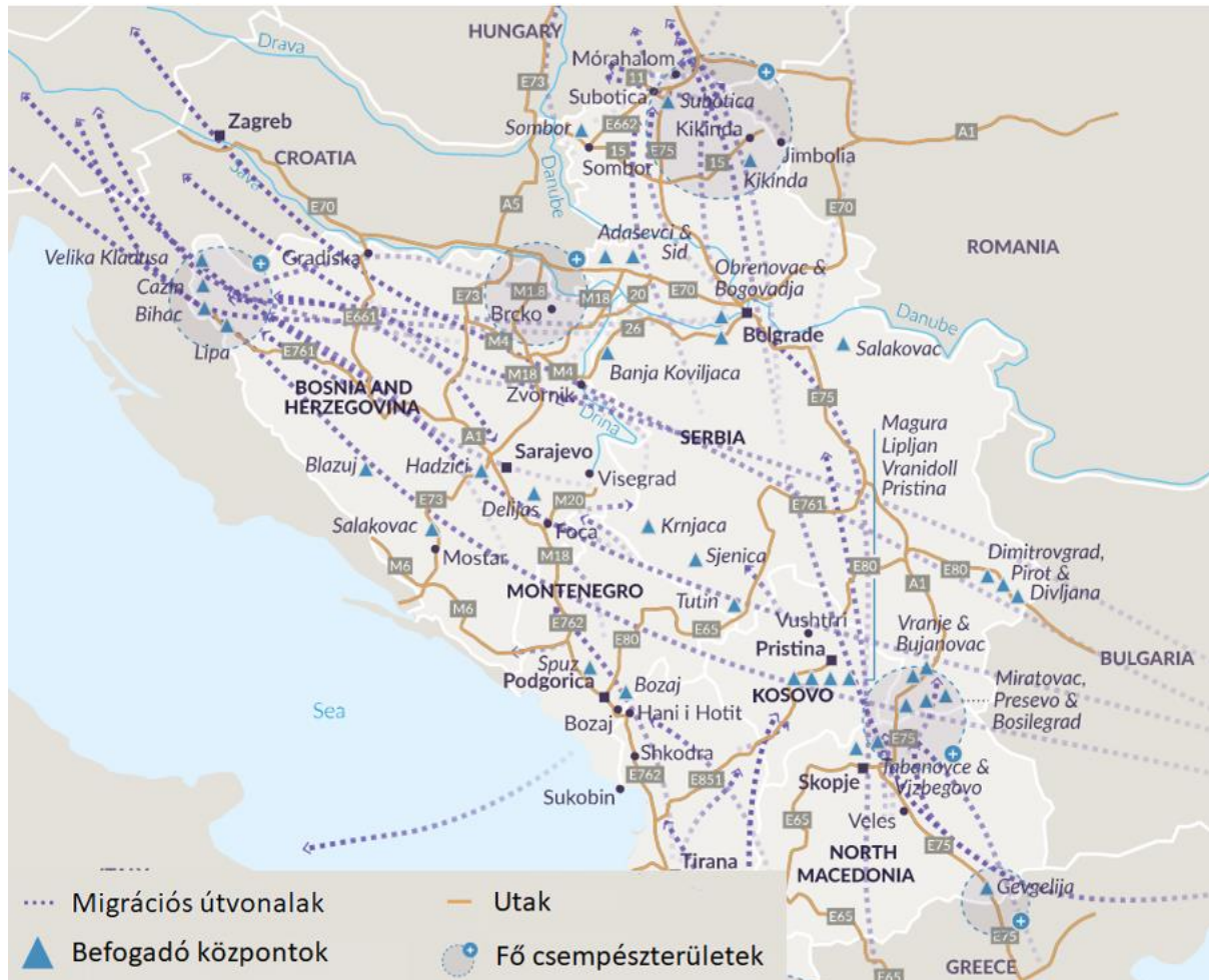
4. ábra: Migráncsempészség „hotspot”-ok 2020-ban 48

teljesítőkre, de például üveggolyókat is dobtak vagy lőttek már rájuk). 44 A migránsok általában nagyobb csoportokban próbálkoznak az átjutással, hogy megosszák a rendőrök és katonák figyelmét. Viszonylag új módszerek számít a határon felszerelt kamerák megrongálása vagy eltakarása, például befedése sárral, hogy ne tudják a mozgásukat nyomon követni a hatóságok. Gyakori elkövetési módnak számít az alagutak ásása is, amelyből már 24 méter hosszút is találtak a magyar határ őrei. 45 Nem maradnak el a folyami átkelési kísérletek sem. Magyarországon idén az augusztusig regisztrált bűncselekményekből 727 esett az embercsempészség kategóriájába, míg tavaly ez a szám egész évben 635, 2020-ban pedig 257 volt. 46 Szintén beszédes adat, hogy a magyar börtönökben lévő fogvatartottaknak jelenleg több mint 10%-a embercsempész (ez több mint kétezer embert jelent, akiknek 88%-a nem magyar állampolgár). 47